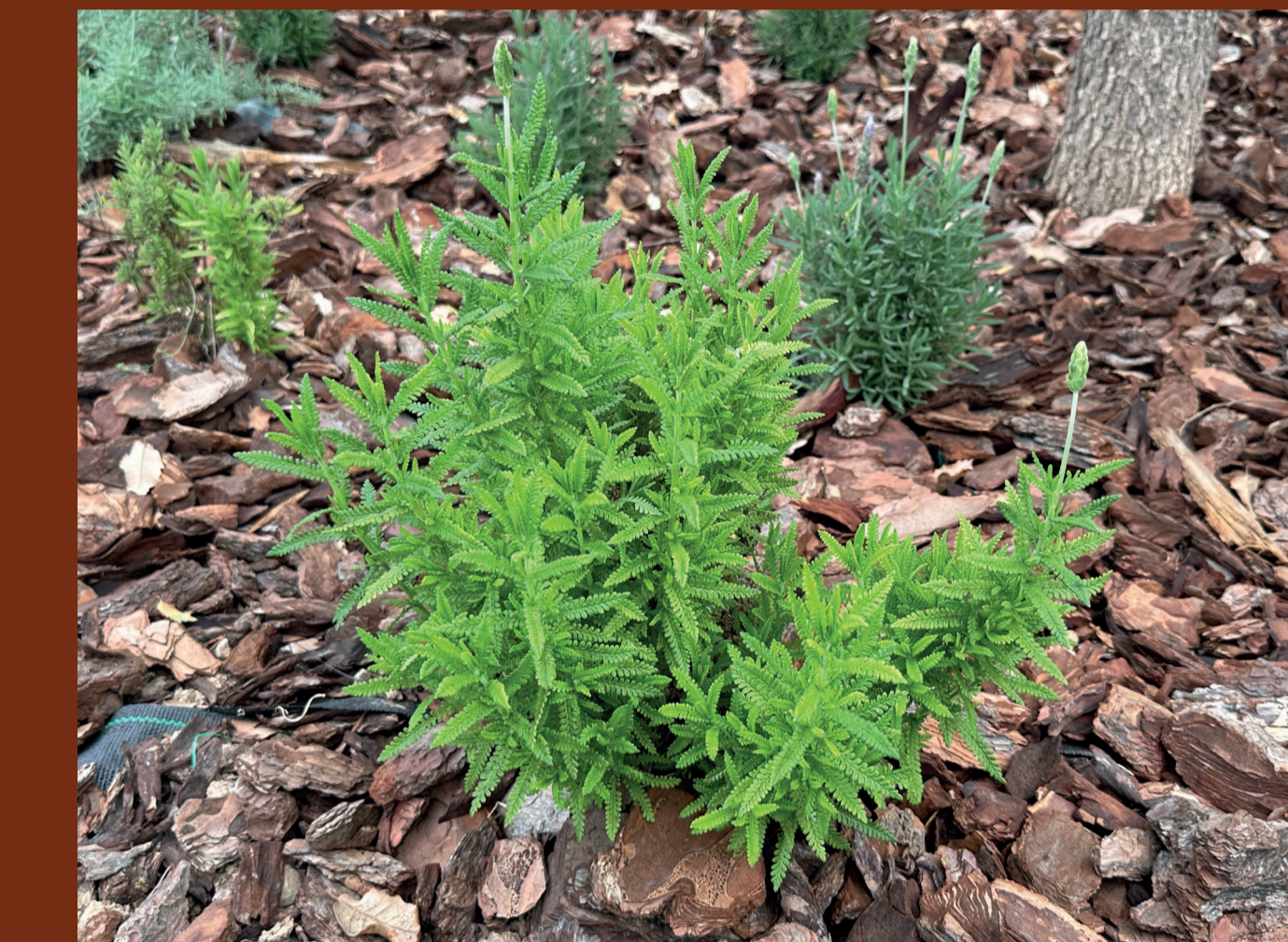
Lavanda dentada / Lavandula dentata