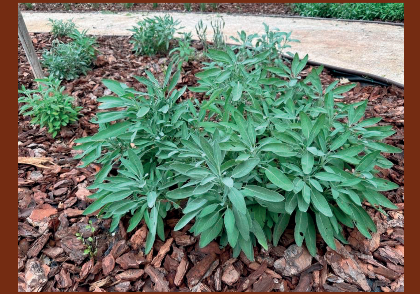
Salvia / Salvia officinalis