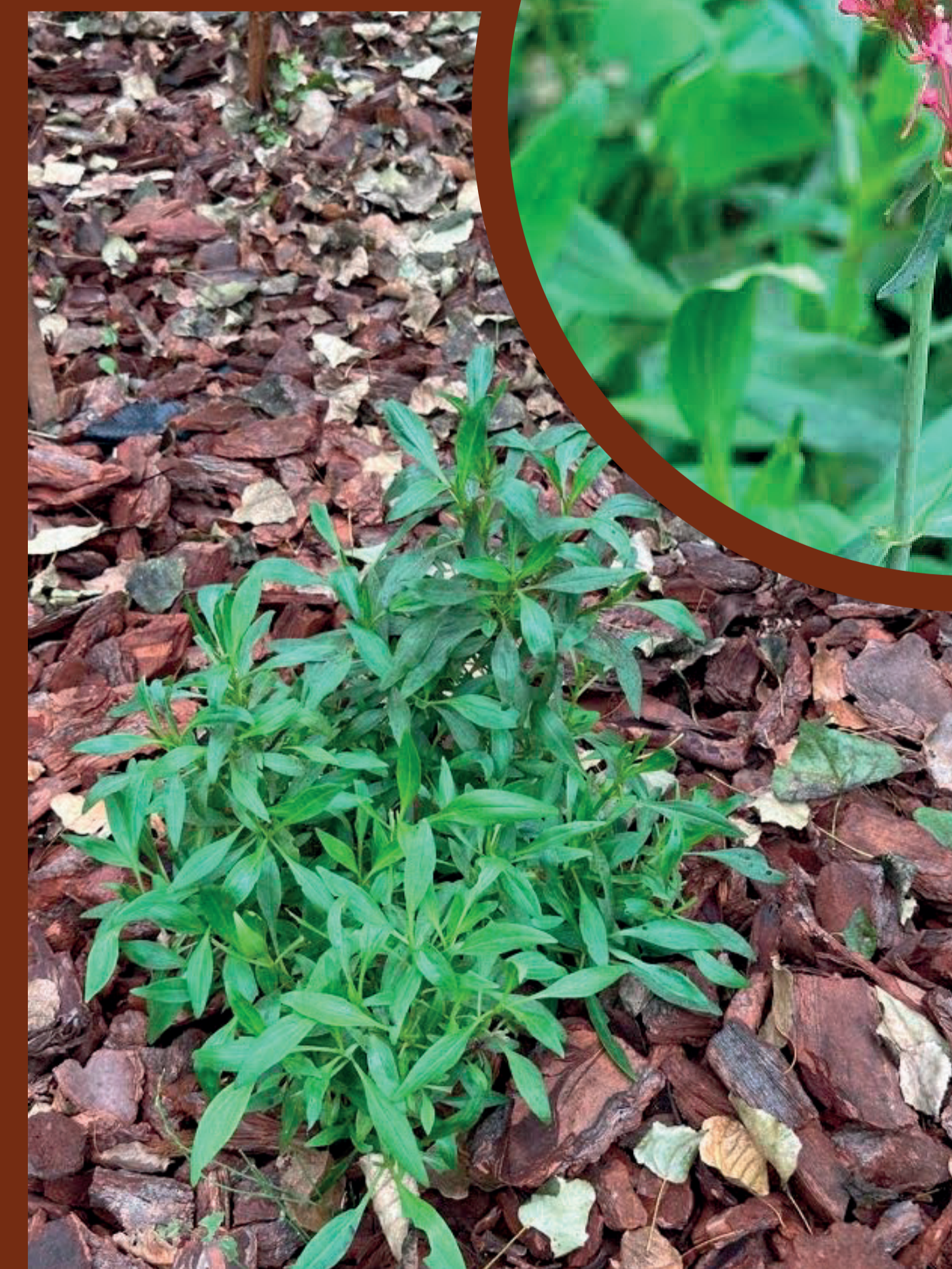
Valeriana Roja Centranthus ruber