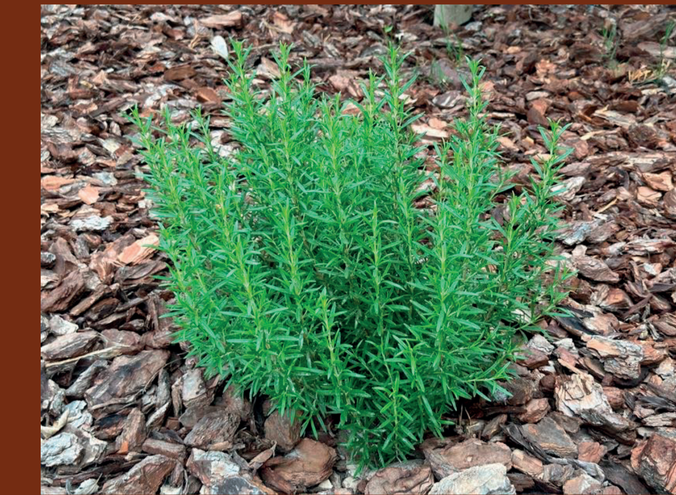
Romer / Salvia rosmarinus