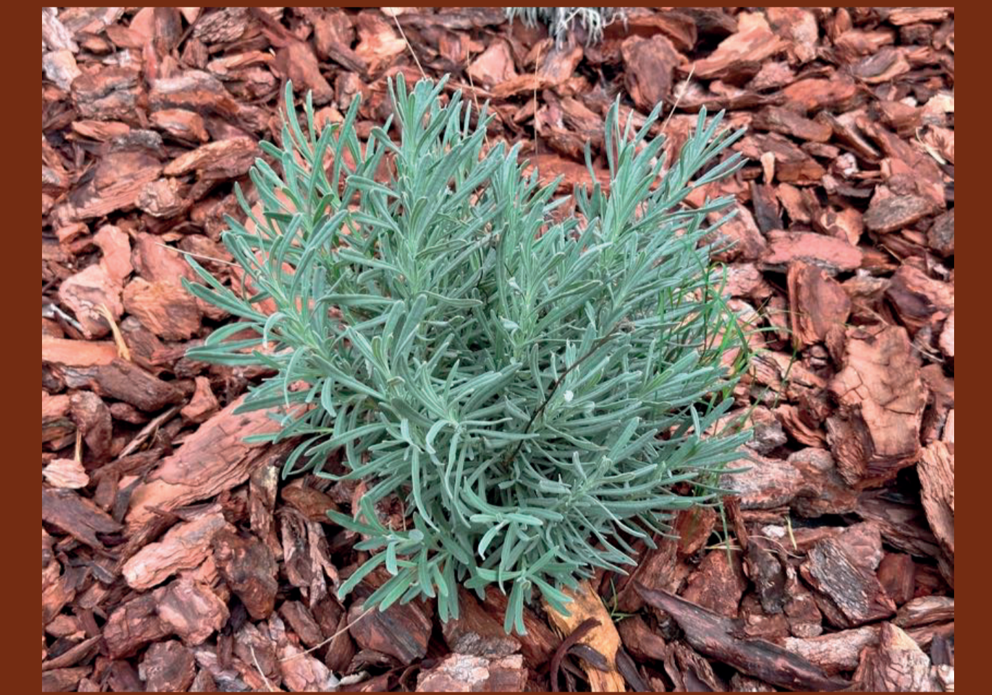
Lavanda/Espliego / Lavandula angustifolia