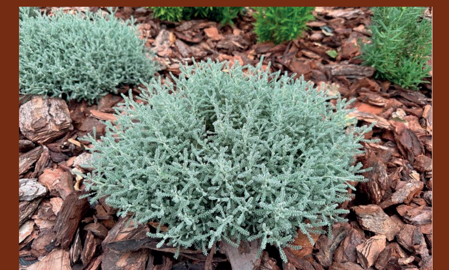
Santolina / Santolina chamaecyparissus