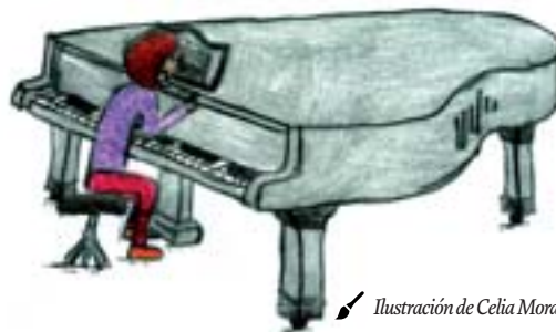
Ilustración de Celia Morales

Igual que una escala. O como la vida misma.