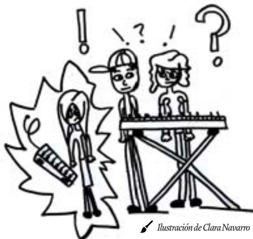
Ilustración de Clara Navarro

Son estas declaraciones solemnes, indicios de una madurez que aún está lejísimos de todos los restantes aspectos de su vida con los aciertos y los errores de su hija en la cabeza. Y entonces, un día cualquiera, a cualquier hora, asisten al prodigio de la velocidad y la armonía, porque los dedos rebeldes se han vuelto dóciles, la montaña infranqueable se ha convertido en llanura, y el punto negro donde el preludio se atascaba para hundirse invariablemente ha desaparecido, aunque sólo sea para ceder su lugar a otra nota del quinto pentagrama, en la que todo vuelve a empezar.