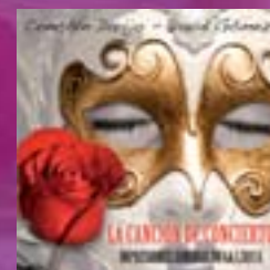
Portada del disco

Miguel), así como figuras de la "melodía" francesa (Fauré, Debussy) y la frescura y el virtuosismo de autores italianos (Arditi y Benedict).