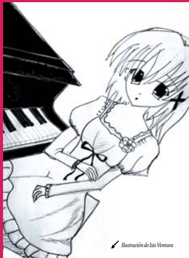
Ilustración de Isis Ventura

- Vamos a ver Elisa, vamos a ver...- grita ella sola, y desde el piso de arriba, los dos escuchan como si pudieran verla, acalorada y sudorosa, furiosa con su torpeza, resoplando mientras intenta disciplinarse ante el teclado, advirtiéndose a sí misma con el dedo levantado -. Ahora lo vas a hacer bien, ¿me oyes? ¡Ahora te va a salir bien!