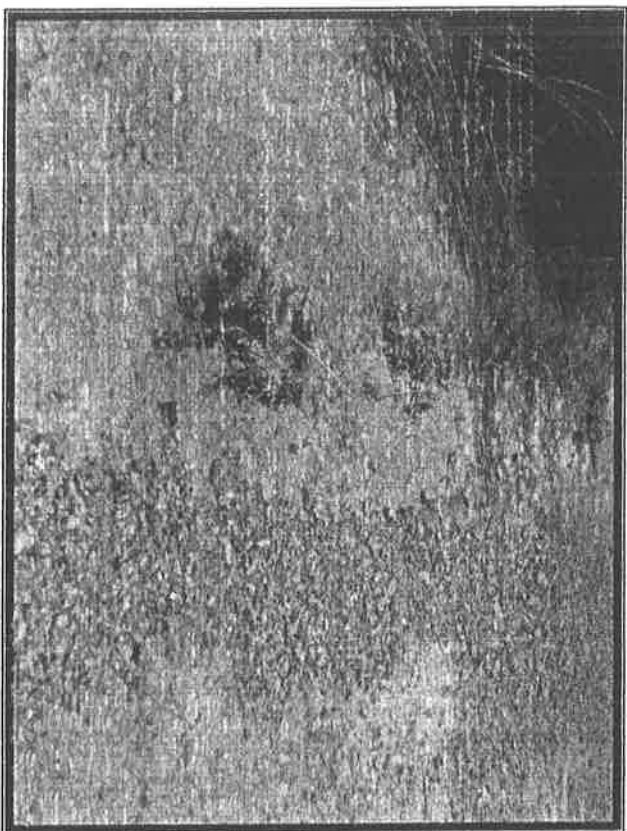
ARRIBA.- Lixiviados fuera del recinto del vertedero.- ABAJO.- Curso de los lixiviados hasta fuera del vertedero