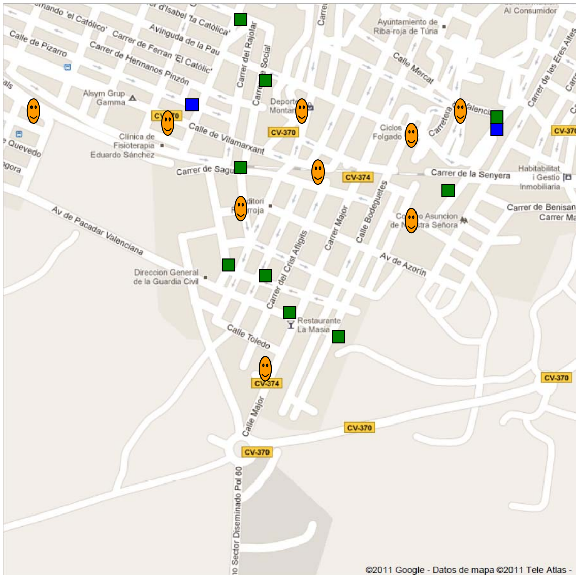
Figura 4. Zona Sur.