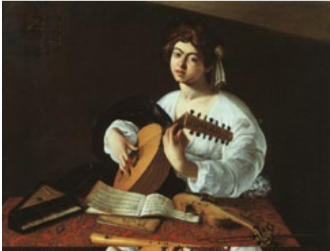
Joven tocando el laúd. CARAVAGGIO