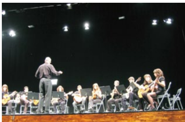
Grup de guitarres del Conservatori de Riba-roja