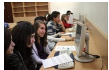
Mireu qué guapos els joves informàtics