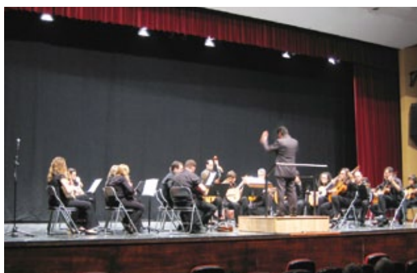
Orquesta de pulso y púa Villa de Chiva