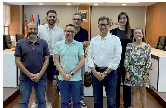
REUNIÓN de parte del equipo técnico de la Universitat de València junto con concejales y técnico del Ayuntamiento de Riba-roja de Túria