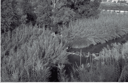
L'ASSUT DEL RIU TÚRIA