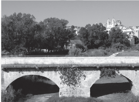
IMATGE DE RIBA-ROJA DEL TÚRIA DES DEL PONT VELL